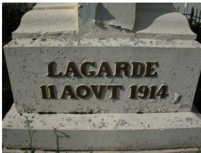
Lagarde - monument français (détail)