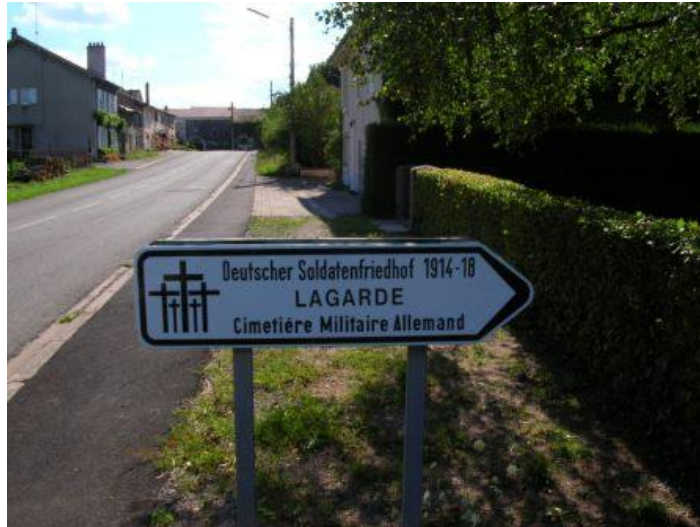
Lagarde - entrée du cimetière allemand