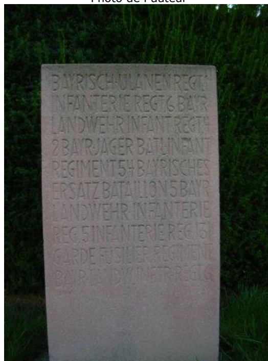
Lagarde - stèle allemande avec la liste des régiments