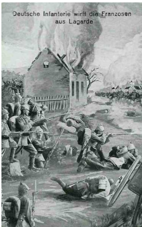
Combat de Lagarde

Le chef du 3 e bataillon donne l'ordre de retraite et les sections se replient vers le pont de Xures, mais celui-ci se trouve sous le feu du 131 e R.I. allemand au nord, et du 138 e R.I. au sud du canal. L'artillerie allemande continue à bombarder l'intérieur du village de Lagarde. Au sud, l'infanterie allemande débouche du bois de la Garenne. Une section de mitrailleuses françaises réussit à l'arrêter, mais les munitions commencent à s'épuiser.