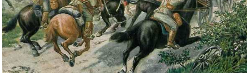
Prise d'une batterie française par des uhlands